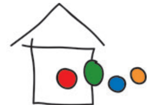
Katholisches Familienzentrum «St. Martinus» im Kreuz-Köln-Nord